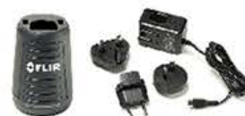
充電器 (ACアダプタ付) ¥30,000