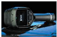
国内フルメンテナンス