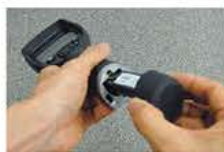
リプレーサブルバッテリー