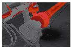
閾値設定機能 カラーアラーム機能