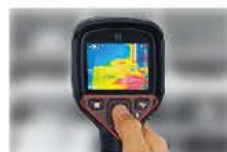
片手で全ての操作が可能