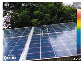
デジタルカメラモード

MSX®機能(スーパーファインコントラスト機能)は、リアルタイムで画像を補正することができ、構造物の詳細や発熱箇所の判別が熱画像上で容易に行えます。また、デジタルカメラモードとの同時撮影も可能で、同画角の可視画像を簡単に生成することができます。